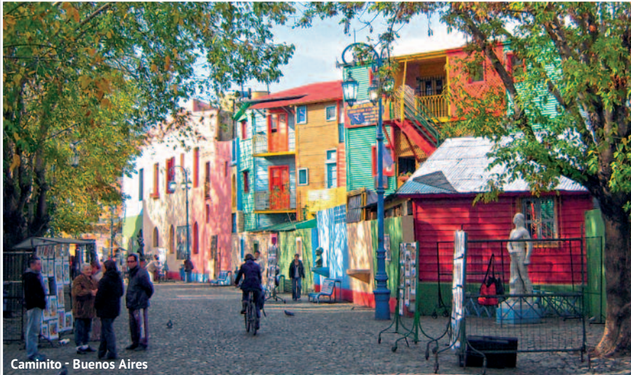
Caminito - Buenos Aires