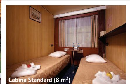
Cabina Standard (8 m 2 )