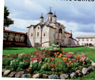
SAN CIRILO DEL LAGO BLANCO

- Visita Panorámica. En las confluencias de los ríos Kotorols y Volga está situada la ciudad más grande del Anillo de Oro, Yaroslavl. Fundada en el siglo X por el príncipe ruso Yaroslavl el Sabio. Gran centro turístico que conserva monumentos históricos y arquitectónicos como la Iglesia del Profeta Elías, La Iglesia de la Natividad de Cristo y San Miguel Arcángel. Su centro urbano ha sido declarado "Patrimonio de la Humanidad" por la UNESCO en 2005. Monasterio de la Transfiguración: Es la construcción más antigua de la ciudad, formada por la Iglesia de 5 cúpulas y la torre de aguja dorada. Iglesia del profeta Elías donde podemos apreciar sus frescos pintados por uno de los iconografos más destacados del siglo XVII, Nikita Gouriyev. Los artistas plasmaron en los frescos únicamente escenas de la vida cotidiana, por lo que su visita nos da una idea de cómo se desarrollaba la vida en Rusia en el siglo XVII.