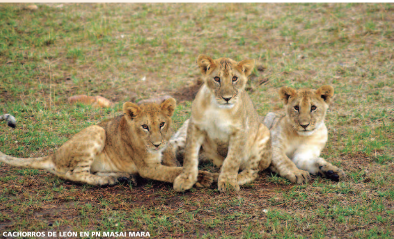
CACHORROS DE LEÓN EN PN MASAI MARA