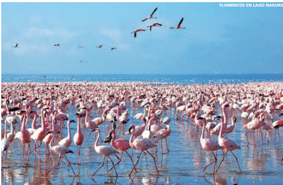
FLAMENCOS EN LAGO NAKURU

HOTELES TURISTA SUP./ PRIMERA Incluyendo PENSIÓN COMPLETA (5 DESAYUNOS + 4 ALMUERZOS + 5 CENAS) + 4 VISITAS