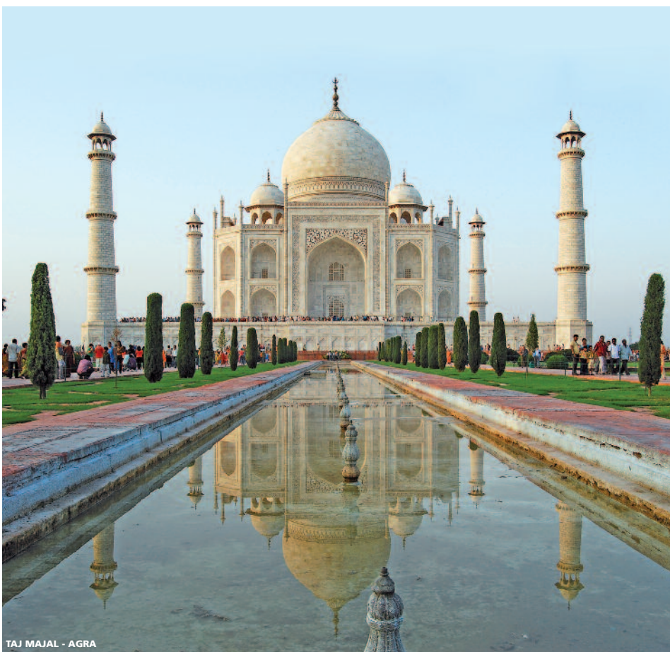
TAJ MAJAL - AGRA

Salidas GARANTIZADAS EN ESPAÑOL (desde 2 personas) Salidas DOMINGOS