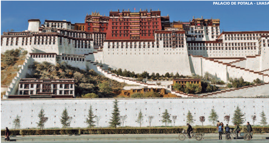
PALACIO DE POTALA - LHASA

11 días (10 noches de hotel) desde 3.455 USD