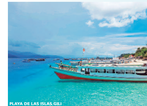
PLAYA DE LAS ISLAS GILI

Notas y Condiciones: - Este programa está sujeto a Condiciones Particulares (C.E.E.C.). - Por razones técnicas el orden de las visitas puede variar así como ser sustituidas por otras similares manteniéndose en contenido del programa. - Precios no válidos para Festivales ni durante la celebración de ferias, congresos y eventos deportivos. - Consultar precios a partir del 31 Octubre 2018. - Sugerimos consultar siempre antes de viajar en Sanidad Internacional (www.msc.es) la necesidad de vacunas para las diferentes nacionalidades. Visados: Es responsabilidad del pasajero, llevar su documentación al día, pasaporte, visado y demás requisitos que puedan exigir las autoridades de cada país en función de su nacionalidad. Consulte en el consulado de su país de origen antes de viajar, visados o requisitos de entrada a los lugares donde va a viajar.