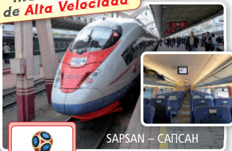
SAPSAN – САПСАН