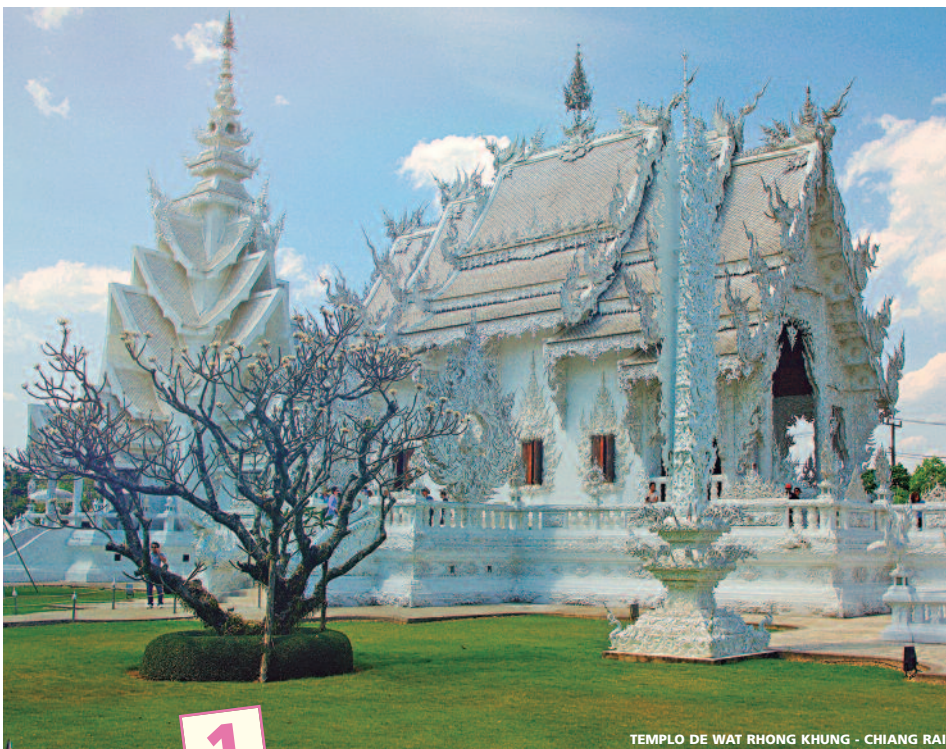
TEMPLO DE WAT RHONG KHUNG - CHIANG RAI

8 días (7 noches de hotel) desde 1.190 USD