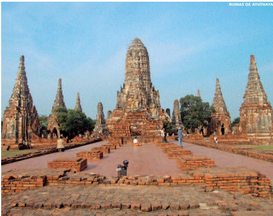
RUINAS DE AYUTHAYA