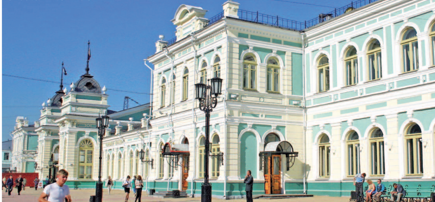
ESTACIÓN DE TREN DE IRKUTSK

• Domingo • Desayuno. Traslado al aeropuerto. (Los clientes que realizan la versión "B" hasta Vladivostok o "C" hasta Pekín, serán trasladados al tren Transiberiano para continuar el viaje).